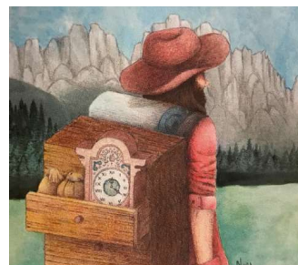
De cramars met klokkenkoffer op de rug

De meest beroemde klok die door de Solari Fabriek werd gemaakt kunnen de niet al te jonge lezers er wel jullie zich misschien nog herinneren. De klok van de 'omvallende' cijfers. Ja inderdaad die cijfers die gevormd werden door telkens de bovenste helft van het nummer te laten omklappen