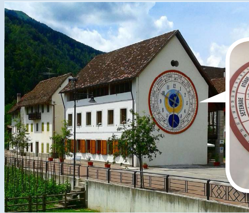
Lezersverhaal: Elbrich Bos