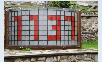
De Orologio a Scacchiera

In het dorpje kun je uiteraard een bezoek brengen aan het klokkenmuseum waar 100 soorten klokken die hier door de eeuwen heen ontworpen zijn in chronologische volgorde naast elkaar staan en hangen. Het is maar een klein museum en alleen een bezoek aan dit museum zou de bochtige en klimmende tocht naar Pesariis niet waard zijn. Sinds het jaar 2000 besloot de gemeente dan ook een soort